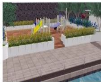
Gambar 15. Zona Rekreasi

Tanjung Pinang yakni Tanjungpinang Dragon Boat Race (Tanjungpinang DBR) yang selama ini dilaksanakan di perairan yang berlokasi di kawasan tepi laut yang ditata.