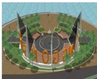
Gambar 14. Zona Gerbang Hiburan/Panggung Hiburan