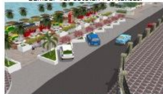
Gambar 13. Setelah revitalisasi

a. Penataan dan Revitalisasi Tahap I/Struktur Bawah (Pek. Pendahuluan, Pek. Tanah, Pek. Struktur Bawah, Pek. Box Duiker, Pek. Pasangan/Geotextile) Rp. 6.200.000.000,-