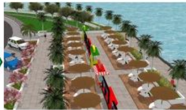
Gambar 10. Setelah revitalisasi