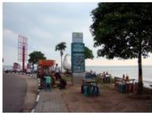
Gambar 9. Sebelum

Adapun rincian kebutuhan biaya untuk pekerjaan dimaksud adalah sebagai berikut: