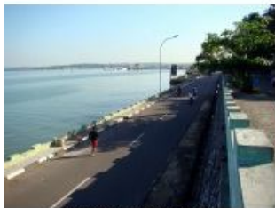
Gambar 11. Sebelum