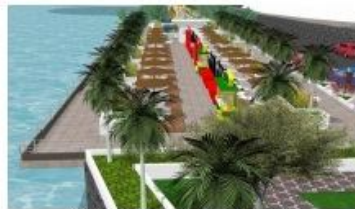
Gambar 12. Setelah revitalisasi